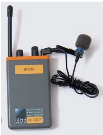
送信機 (ピンマイク型)