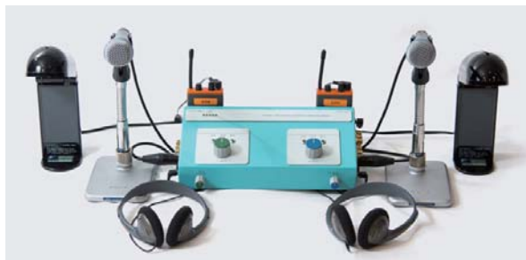
送信機 (スタンドマイク型)・ヘッドホン・手元ライト